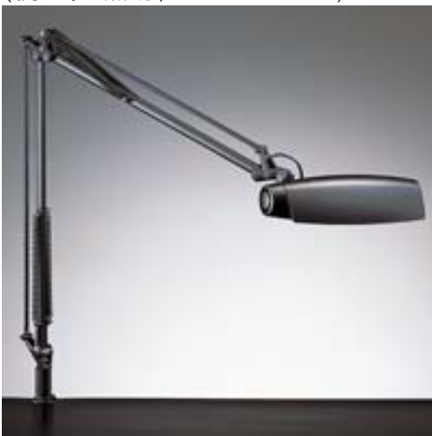
¥ 13,650 アーム長 90cm